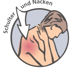
Schulter und Nacken