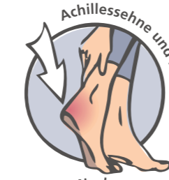
Achillessehne und Ferse